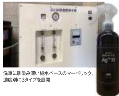
洗車に馴染み深い純水ベースのマーベリック。濃度別に3タイプを展開

銀イオン水の希釈・販売センターとした販売網の構築も予定。加えて自動車以外への販売展開として、大手散水用品メーカーなどとの協業も推進している。 問合せ先・リアルテックサービス TEL:0501754412384