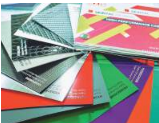
豊富なカラー数や特殊なテクスチャなど、バリエーションはますます豊富に

ソフト99オートサービス 同社では、ラッピングからPPFまで豊富に取り揃えている。この製品群を、今年開設した会員制オンラインショップを通じて事業者向けにも販売中。ラッピング・PPFに限らず、グループ会社のコーティングブランドG・ZOX製の「ラッピングの問い合わせ」