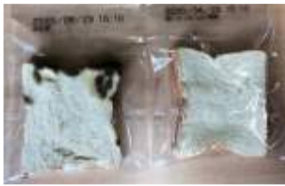
除菌や高い安全性に加え、防カビ性や消臭性にも優れる