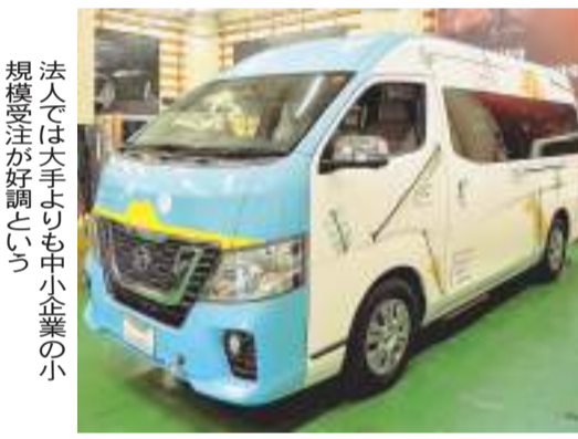
法人では大手よりも中小企業の小規模受注が好調という

容易なカラーチェンジを実現したエアフリーのラッピングフィルムが登場し、拡大を遂げてきたラッピング市場。ドイツの大手フィルムメーカー・オラフォルの国内法人オラフォルジャパンによると、全世界の市場規模は1700億円、全世界では年率100%超の成長市場(2018年推計、施工費ベース)と見られる。うち日本国内は150億円、法人のフリートが130億円、個人のカラーチェンジが20億円規模。今年度のコロナ禍でさえも同社を含め業界全体で対前年を上回るフィルム出荷量が推移しているという。