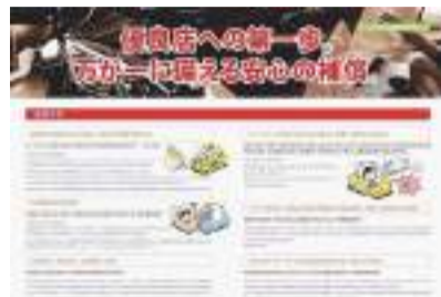
ラッピング施工店に焦点を当てた損害保険。取扱代理店は福島県のエフシーバンク

6つの補償内容のうち、特に自動車管理者賠償責任補償は、スクレーパーでの傷やフィルム剥離時の塗料損傷など、カーラッピング作業に伴う預かり車両