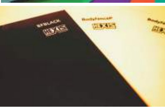
一部ラッピングとニーズが重なる色付きPPF。ハキシスからもグロスブラックの「ボディフェンスブラック」が新登場