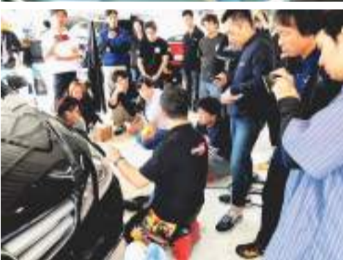
認定制度を設定しないオラフォールの数少ないメーカー公式セミナー