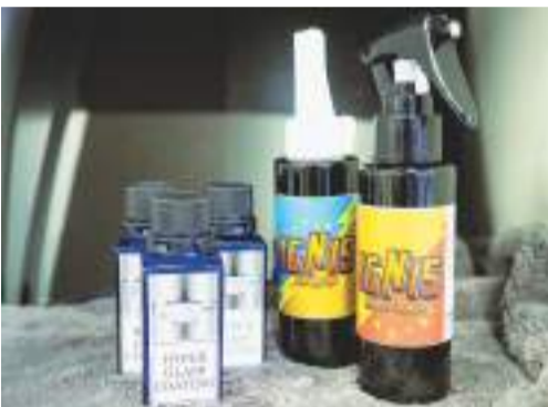
ラッピングやPPF面にも施工可能なコート剤。業務用とユーザー用を販売中

また、施工前には自社独自の説明資料を用いて施工方法や補償内容、再剥離時のリスクなどを対事業者・対エンドユーザーそれぞれ丁寧に説明。合わせて施工後のメンテナンス方法として同社オリジナルブランドのコーティング剤「ハイパーガラスコーティ