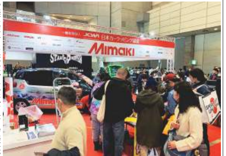
イベントへの出展などを通じて認知拡大、市場拡大に取り組むJCWA

6つの補償内容のうち、特に自動車管理者賠償責任補償は、スクレーパーでの傷やフィルム剥離時の塗料損傷など、カーラッピング作業に伴う預かり車両