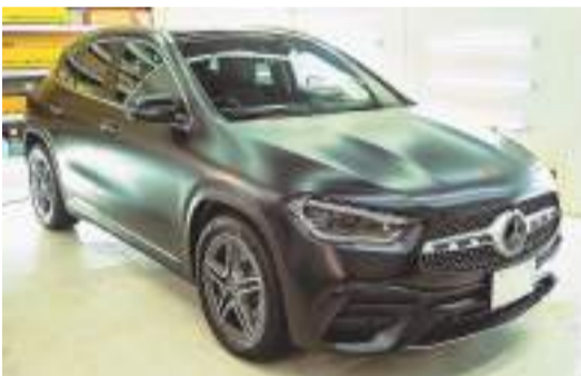
輸入車を中心に着実に広がる個人需要