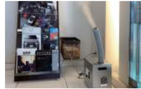
接客品質を重視する高級国産ディーラーでは噴霧形式で導入