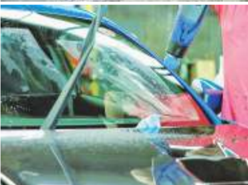
ラッピングからPPF、ガラスシールドまで幅広く施工し、技術共有にも積極的な同社