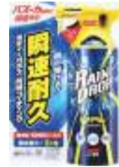
ソフト99初の自動車専用ワックスと、昨年ヒットした簡易コーティング剤

ポディコートを開発。消費者市場で培った優れた作業性やモータースポーツでのブランド活動、施工者をフォローするパートナープログラムなどを通じて、後発ながら市場に割って入っていった。現在では同プログラム参加企業は1千店舗を大きく超えており、ジャパンブランドは海外でも高く評価され、G,ZOXを看板に掲げる専門ショップは世界14カ国103店舗にまで拡大している。 コンプラ重視・規模縮小の市場に対応