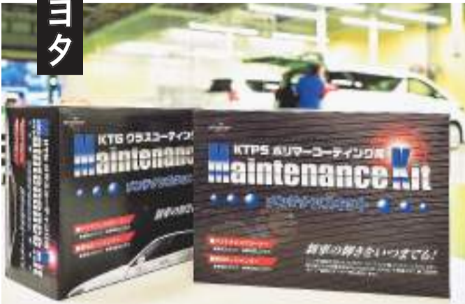
高価な硬化型から比較的廉価なポリマー系まで幅広くコート剤を用意。独自ブランドのコート剤が人気という